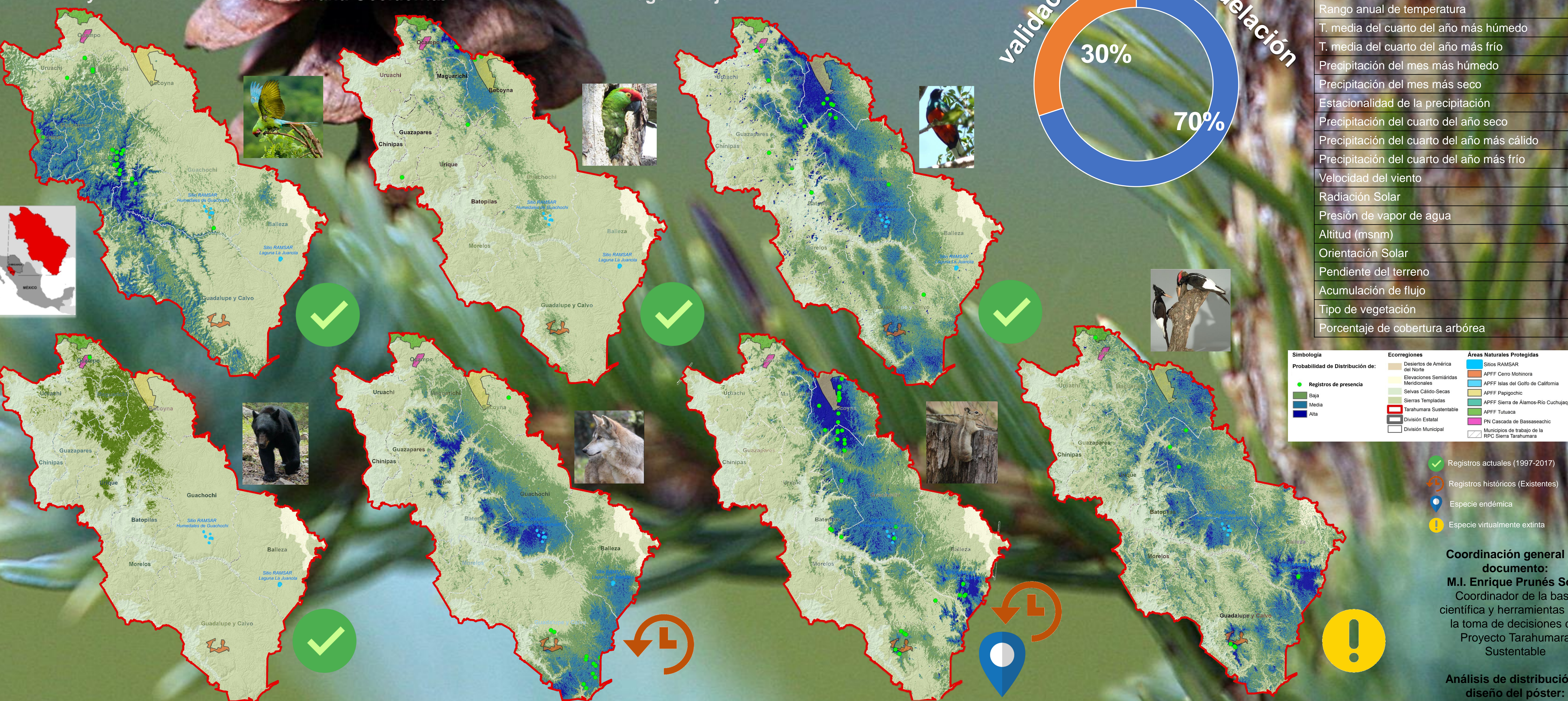
Euptilotis neoxenus Trogón Orejón